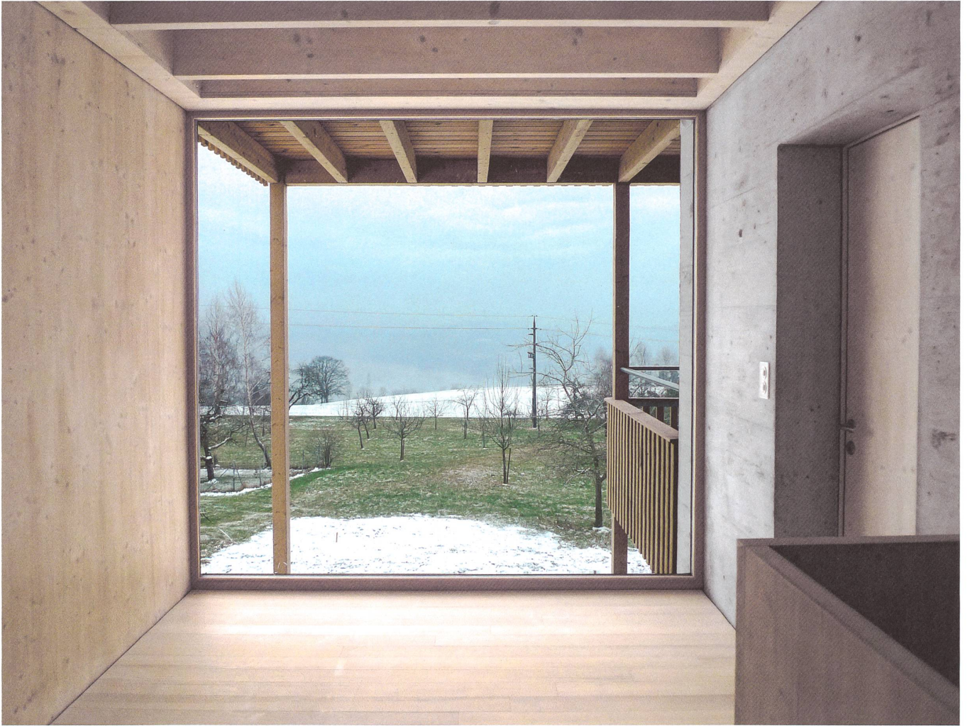
Der Baumgarten-, Licht- und Landschaftsblick aus dem neuen Stöckli im Buholz, eingefügt wie das alte in den prächtigen Baumgarten. Rechts die betonierte Wand, die das Holzhaus zusammenhält.