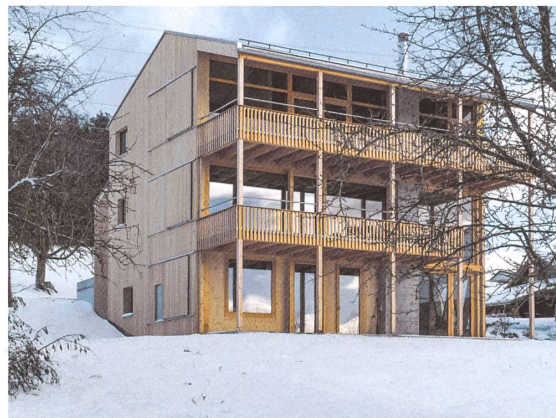
Das neue Stöckli: aus Holz, um neunzig Grad gedreht, ebenfalls mit Laube. Links die Familien-, rechts die Schwesternwohnung.