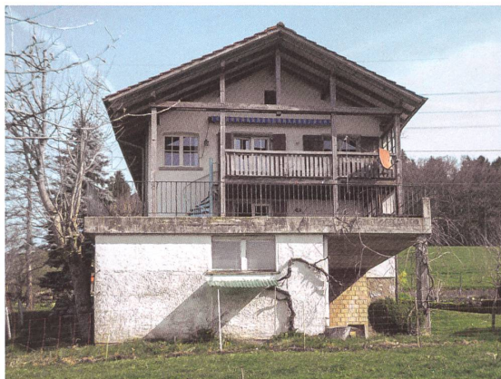
Das alte Stöckli: gemauert, gebastelt, mit Laube und Terrasse.