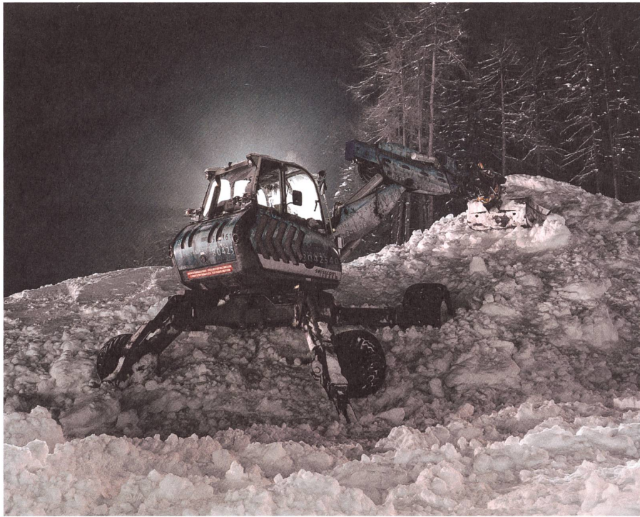
Das kritisch-ratlose Bild der Landschaft: Jules Spinatsch, Snow Management, Applied Landscapes, Unit PAMM, 2005, C-Print, auf Alu, Ed. 1/7, 80×100 cm, Bündner Kunstmuseum Chur, Ankauf.