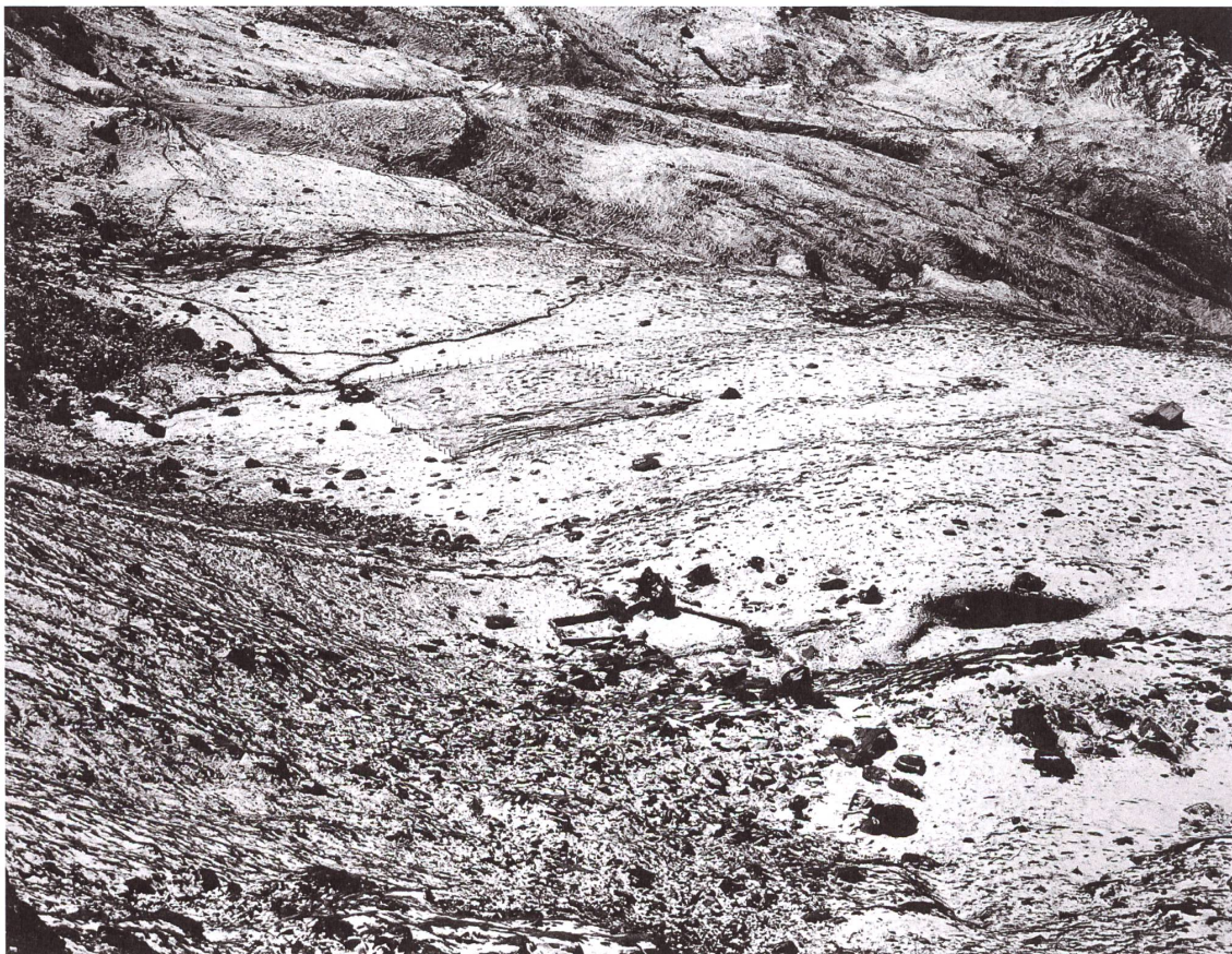
Das Bild der Realien: Guido Baselgia, Val Fex, Alp Munt, 2000, Bromsilber-Baryt-Abzug, 57,5×74 cm, Bündner Kunstmuseum Chur, Ankauf 2001.