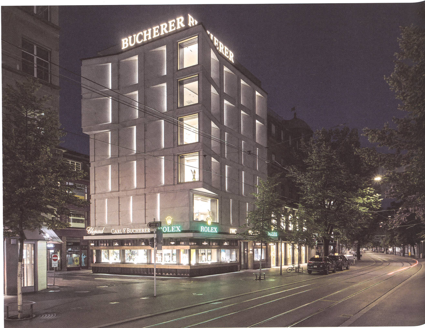
Bucherer an der Bahnhofstrasse in Zürich: Die plastische Marmorfassade vereint geschlossene Verkaufs- und befensterte Bürogeschosse. Erker schaffen städtebauliche Bezüge.

Text: Palle Petersen, Fotos: Georg Aerni