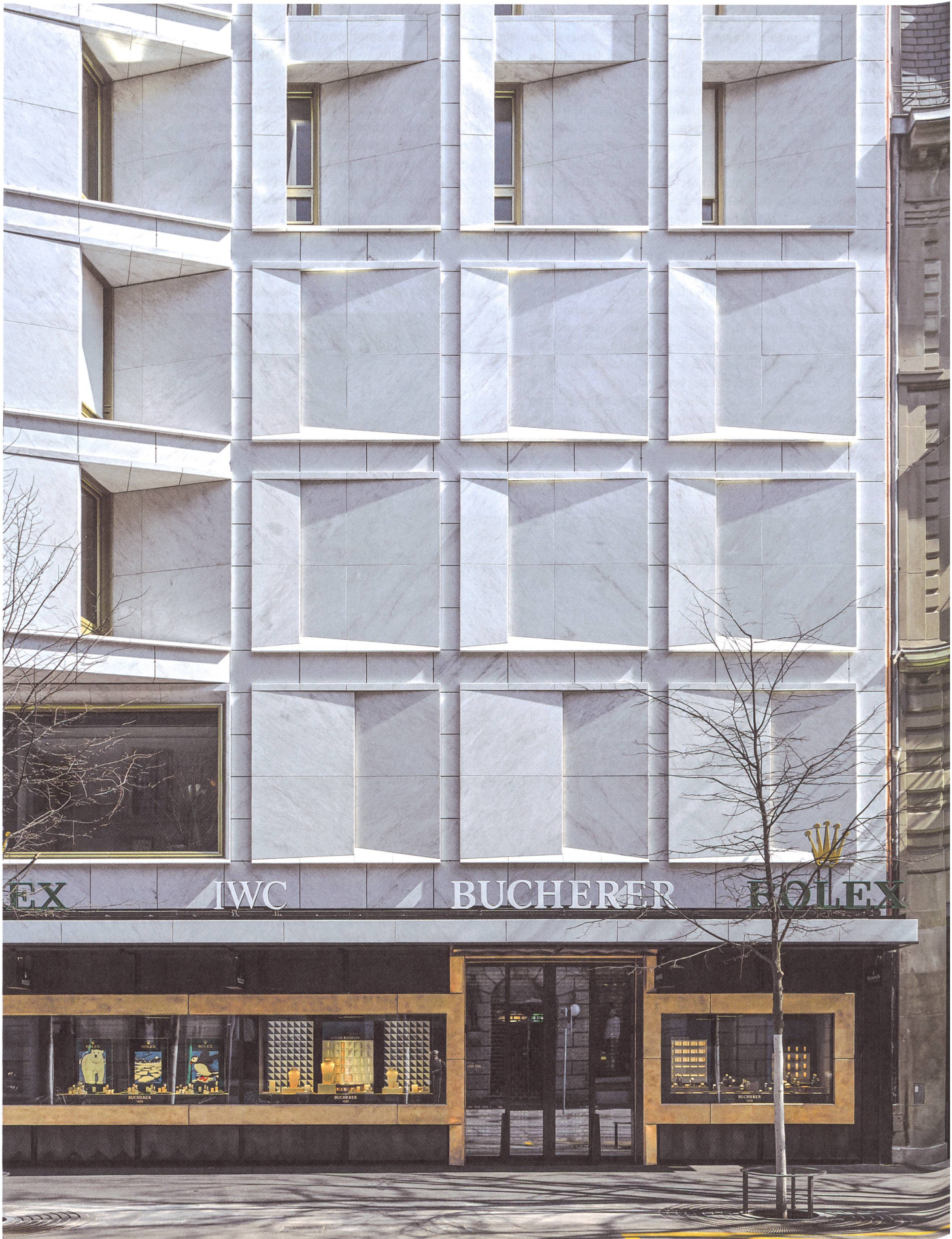
Das strukturelle Gitter rahmt das Wechselspiel echter und falscher Bilder. Gekonnt lenkt die Marmorplastik das Licht und spielt mit dem Schatten.