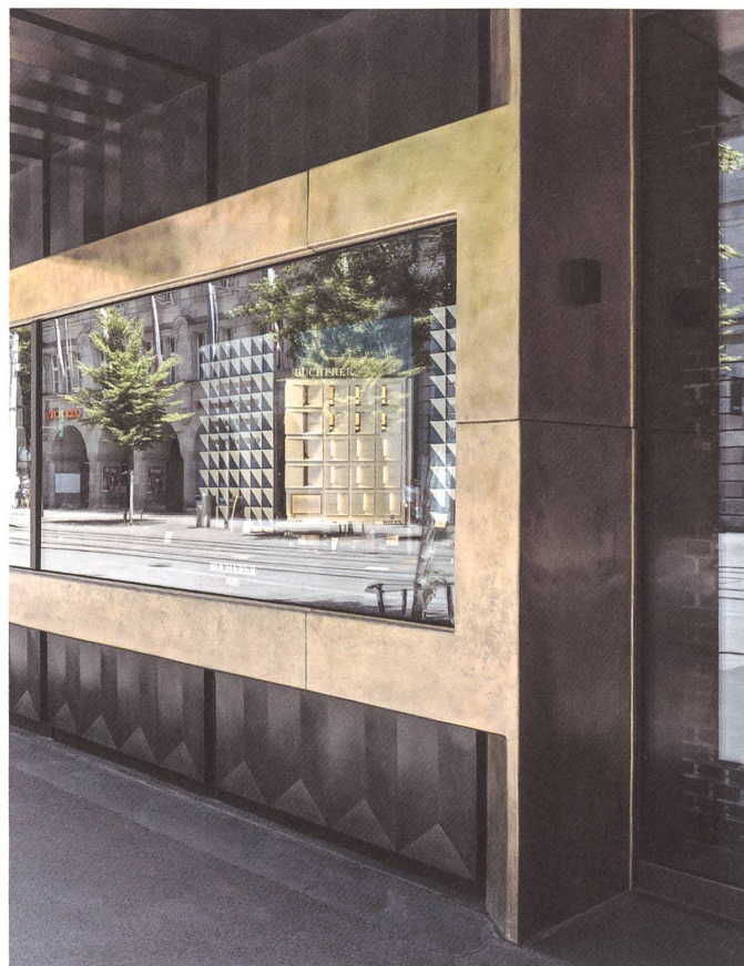
Handwerklicher Bronze guss, industrielle Bautoleranz, obsessives Finish.

Hinter dem diamantartigen Bronzerelief verbergen sich stählerne Fachwerke. Sie steifen die bestehende Stahlstruktur im Erdgeschoss aus und dienen als Rammenschutz gegen Raubattacken. Nahtlos faltet sich das Relief unter das Vordach, das als Relikt des Bestands nicht so recht zur neuen Fassade passen will und das Erdgeschoss gedungen erscheinen lässt. In der Mitte unterbricht ein Schaufensterband das Relief. Es ist beinahe unglaublich: Die Rahmen sind ebenfalls aus Bronze gegossen, notabene