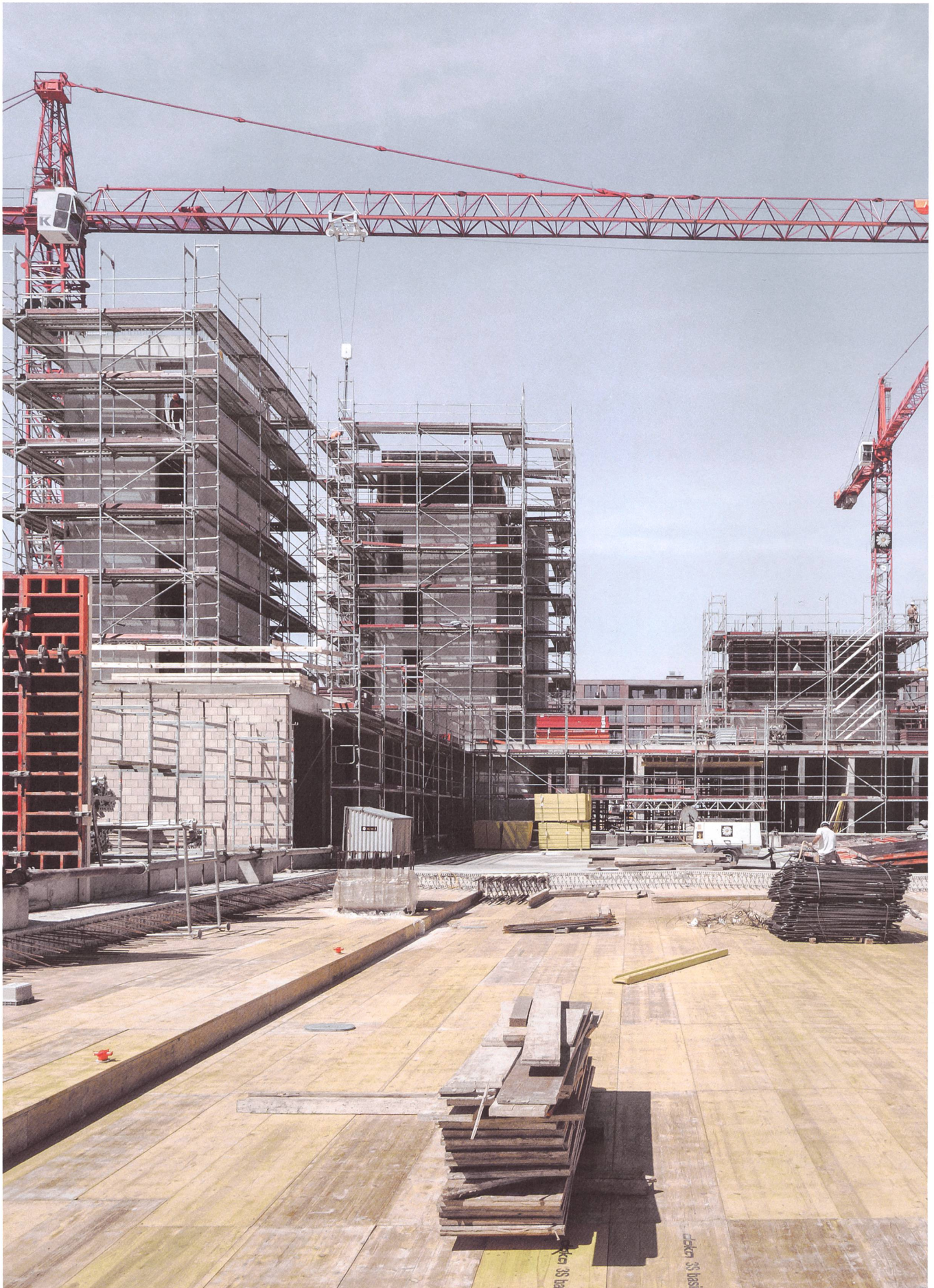
Vorfabrizierter Wohnungsbau: Nach dem Betonieren des Erdgeschosses und der Treppenhäuser dauerte die Montage der Holzbauelemente pro Etappe nur rund einen Monat.