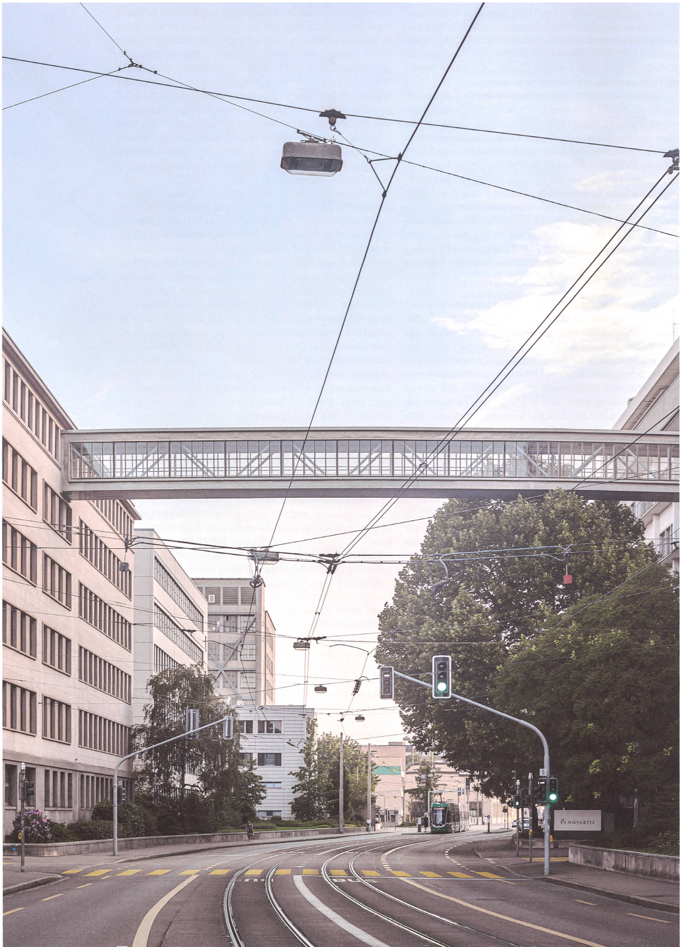
Verlassene Hallen und Gewerbebauten am Klybeckplatz. In zwanzig Jahren könnten hier Hochhäuser über einer unterirdischen S-Bahn-Station stehen.