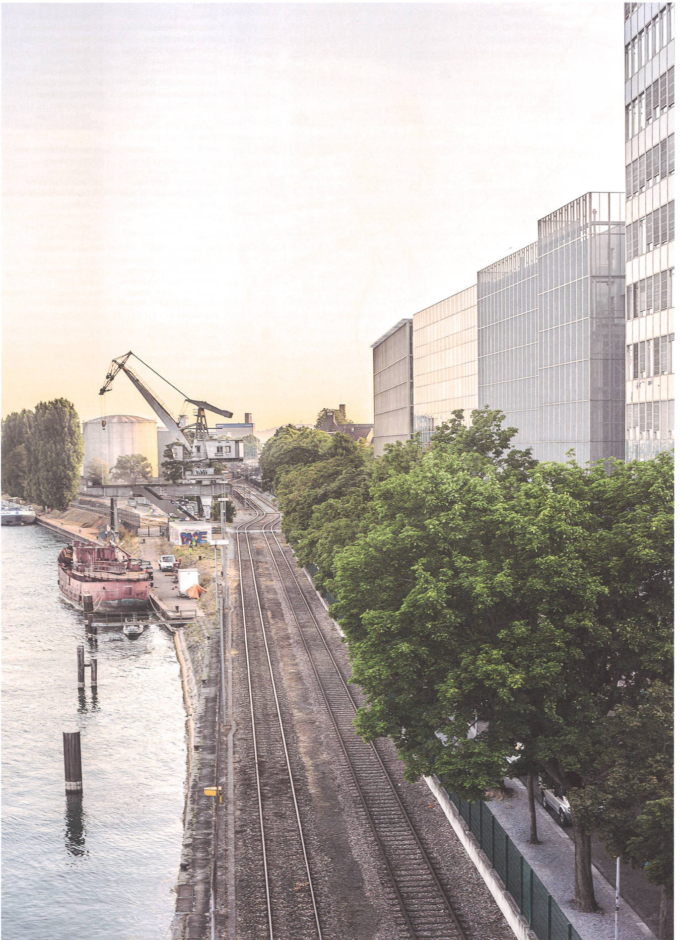
Die Hafenbahn, eine Zäsur zwischen Wohnquartieren und Rheinufer. Der Hafenkran, ein Geschenk von Novartis an die Stadt. Das Hafengebiet, eine Jahrhundertchance.