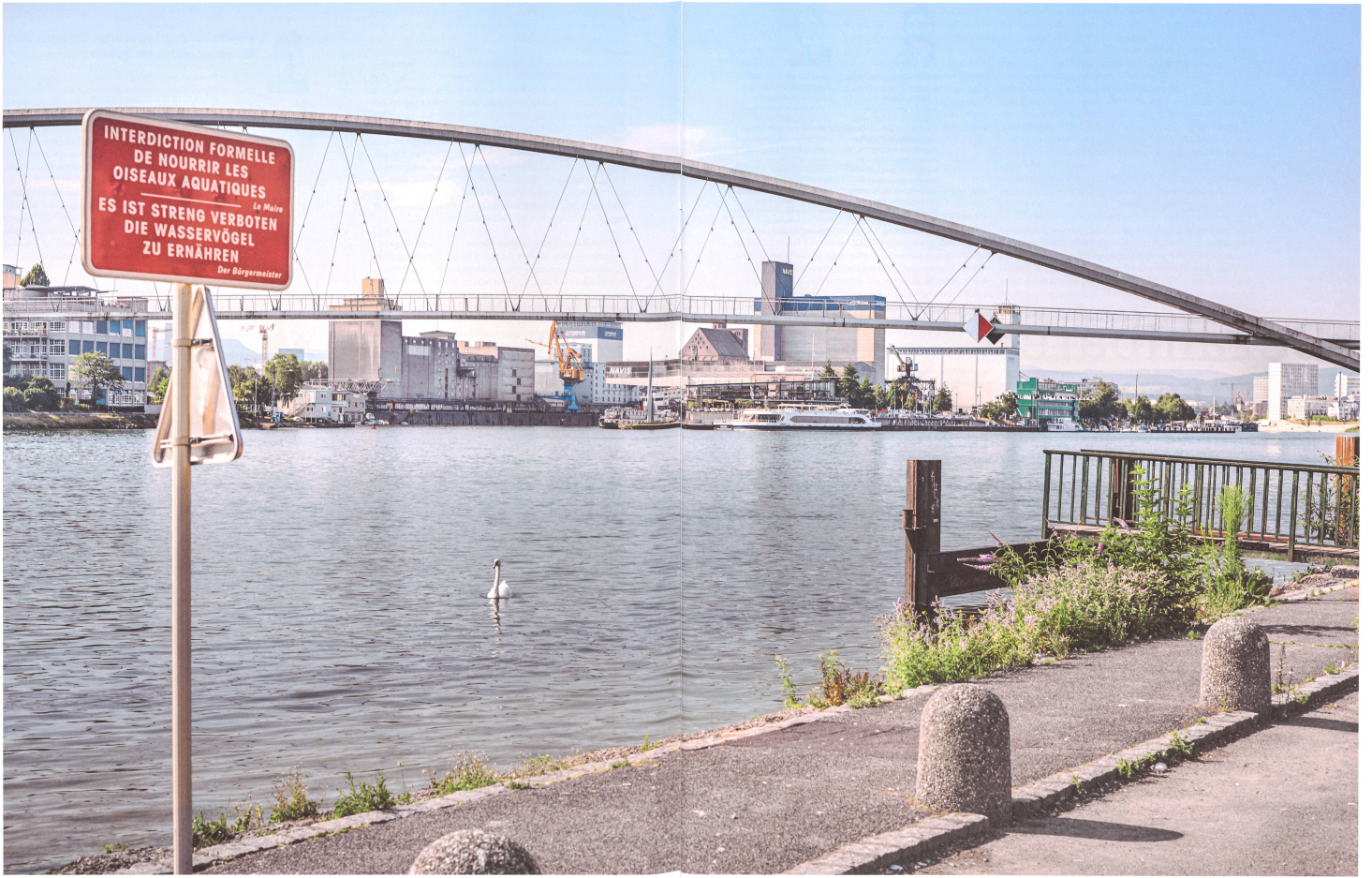
Selt 2007 verbindet die Dreiländerbrücke das französische Hüningen mit dem deutschen Weil am Rhein. Folgt bald der franko-helvetische Brückenschlag?