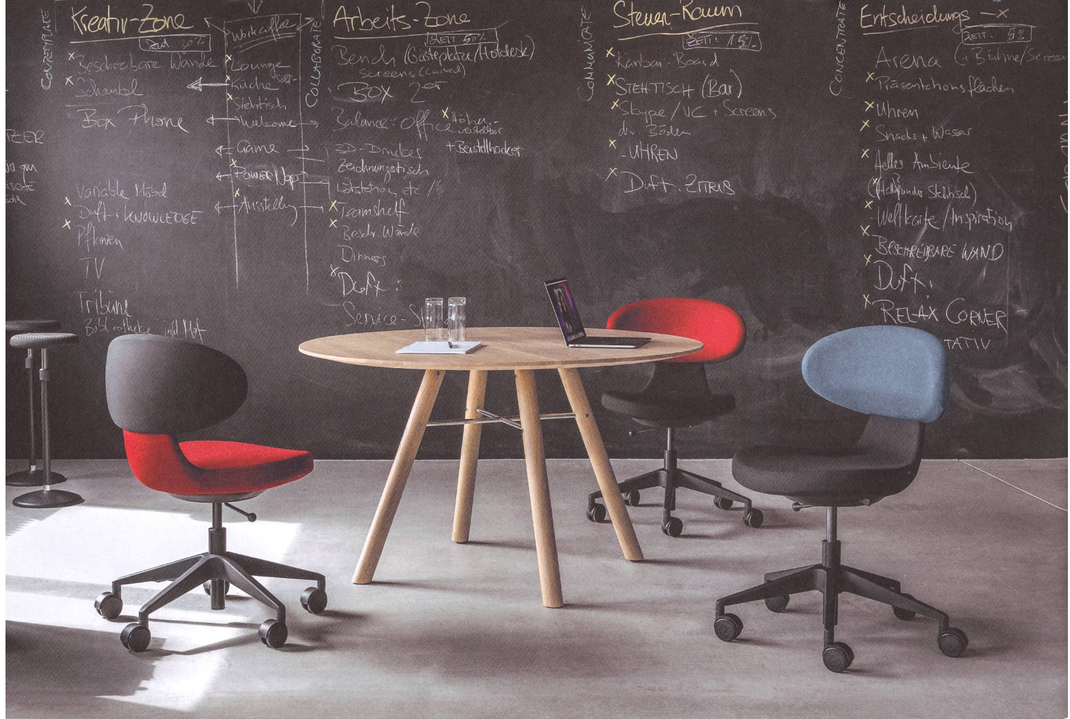
Simplex 3D. Drehstuhl mit dreidimensionaler Beweglichkeit – multifunktional und universell einsetzbar. Design: Greutmann Bolzern