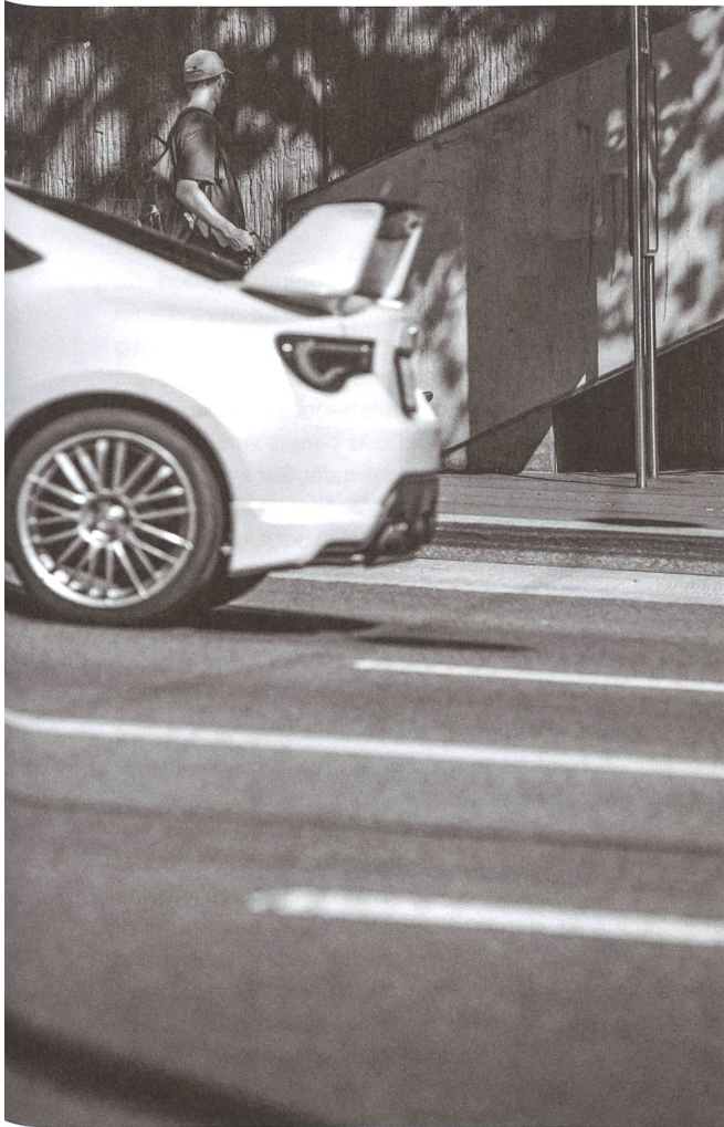
Die Schweiz ist ein Paradies der Verkehrsinfrastruktur, trotzdem wird diese immer weiter ausgebaut.