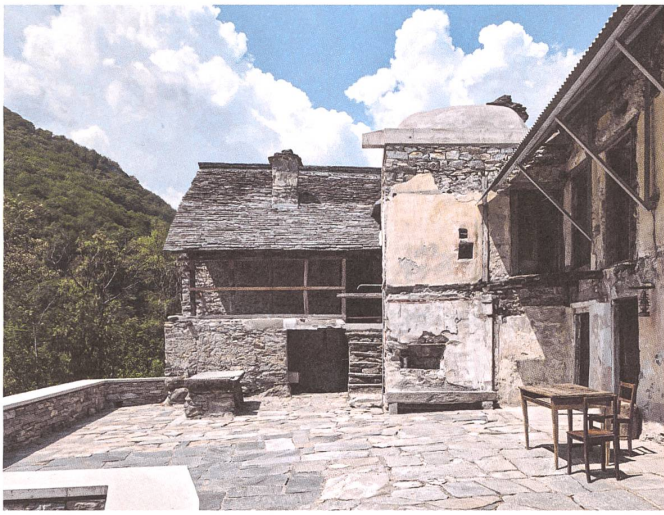
Casa Mosogno: ein Ensemble, zwei neue Dächer, drei Materialien und jede Menge Platz.