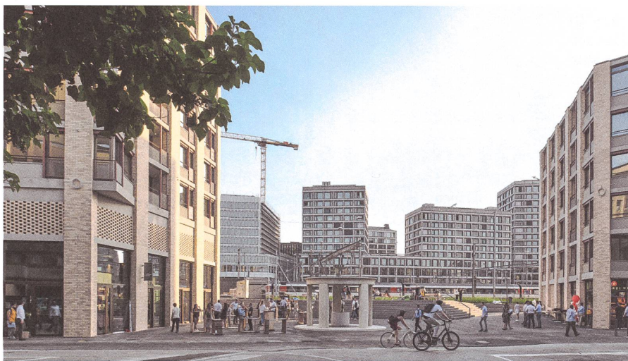
Gegenüber der Europaallee säumt die Zollstrasse das Zürcher Gleismeer.