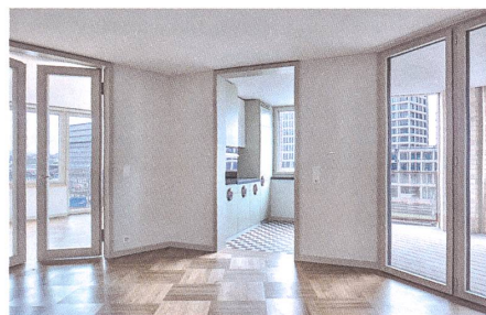
Die Wohnungen fächern sich auf.

Man könnte den Schienenschwung begleiten. Oder man fächert die Bebauung zu dem auf, was Esch Sintzel Architekten – nebst des Sees – als zweite riesige und unverbaubare Freifläche der Stadt Zürich betrachten. Während die Europaallee, sozusagen die gegenüberliegende Uferbebauung, bald fertig ist, bilden die drei Wohn- und Geschäftshäuser den Auftakt der werdenden Zollstrasse. Parallel folgen sie dem verspringenden Strassenverlauf der Blockrandstadt, singen im Chor mit der baulichen Konvention. Zum Gleismeer hin verhalten sie sich autonomer, maximieren durch ihre Fassadenabwicklung die Weitsicht. Was Tucholsky wohl zum Vermarktungsnamen «Gleisribüne» gesagt hätte?