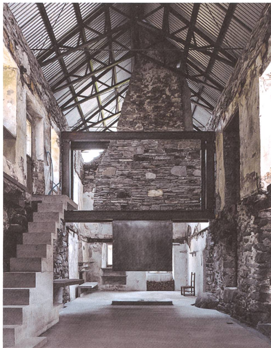
Insenziert: Betonmöbel und ein im Stahlrahmen schwebender Kamin.