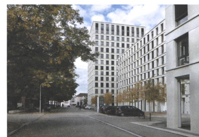
9 Wohn- und Geschäftshaus Connect, Zürich, 2010.