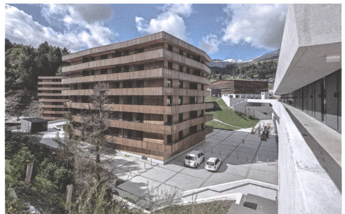
17 Stenna, Flims, 2018 / 19.