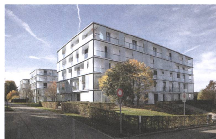
1 Achslenpark, St. Gallen, 2002.