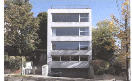
2 Blümlisalpstrasse, Zürich, 2003.