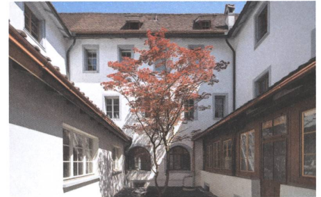
20 Kloster, Stans, 2020.