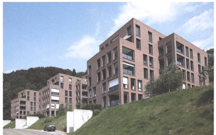
12 Rosenbüchel, St. Gallen, 2011.