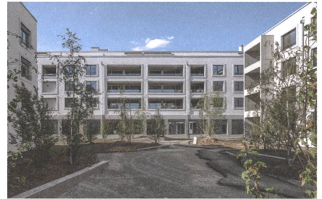
14 Fehlmannmatte, Windisch, 2014.