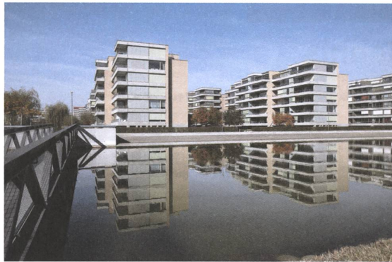
7 Glattpark, Opfikon, 2007.