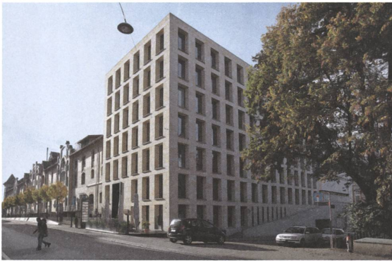
3 Davidstrasse, St. Gallen, 2004.