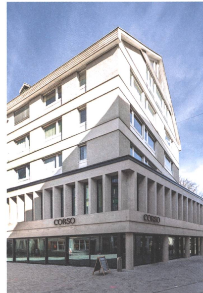
19 Corso, St. Gallen, 2020.