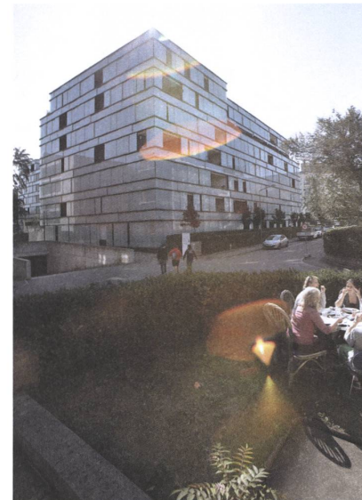
5 Wohnanlage Eichgut, Winterthur, 2005.