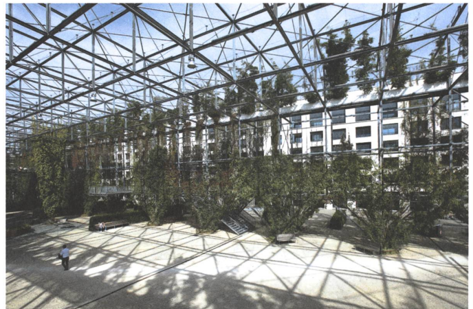
6 Ententeich, Zürich-Oerlikon, 2007.