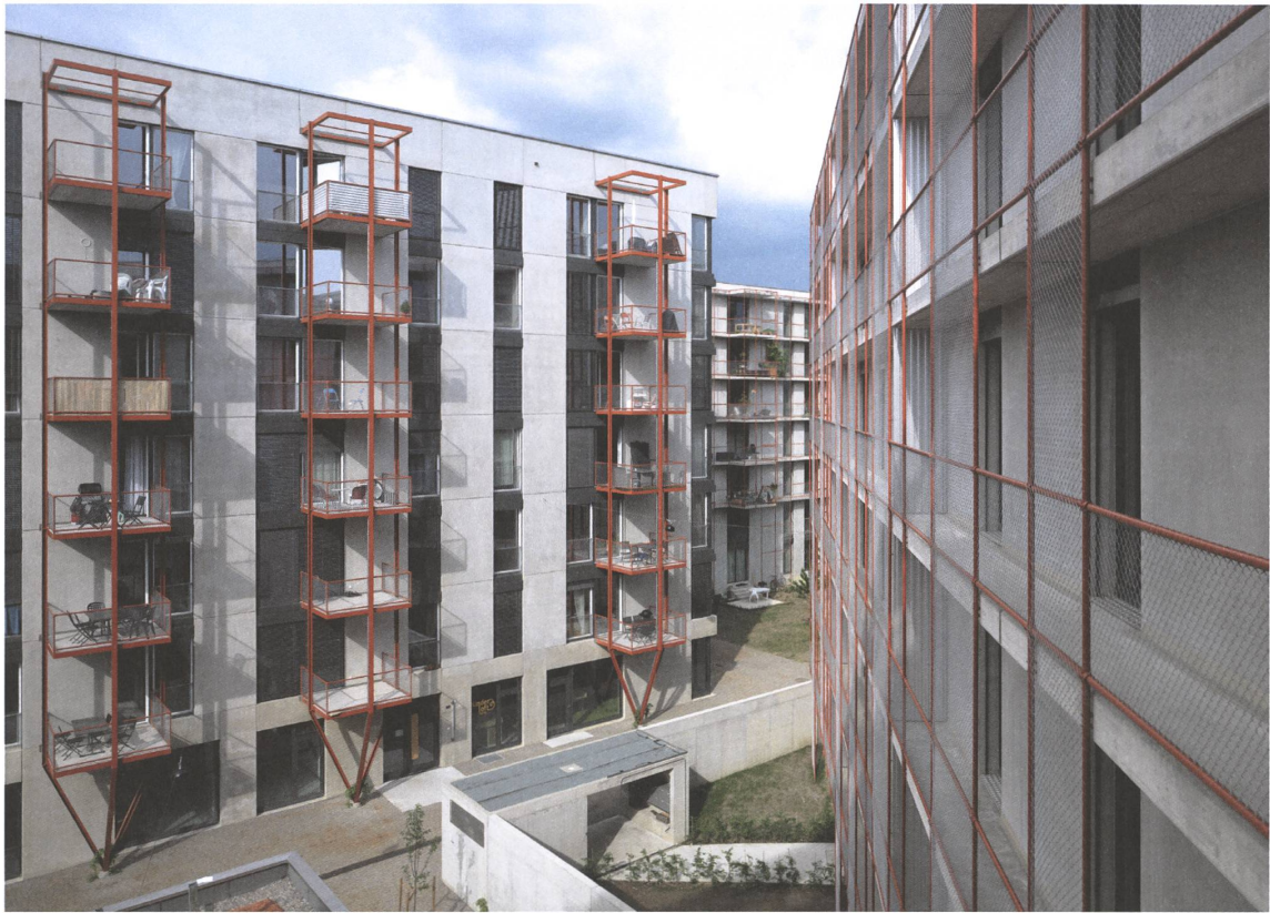
16 Zwicky Süd, Dübendorf, 2016.