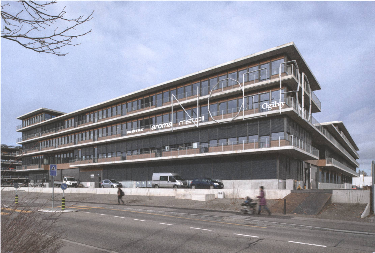
10 Nerd, Zürich, 2011.