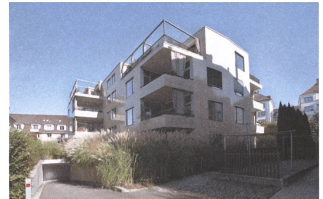
8 Guggachzahn, Zürich, 2008.

Binzmühlestrasse 170a–d, Zürich Bauherrschaft: Anlagestiftung Turidomus, Zürich Architektur: Rothen Architektur, Winterthur Nutzfläche: 18 907 m 2 Bauvolumen: 105 861 m 3 Investitionsvolumen: Fr. 53 Mio. Baubeginn: Frühling 2010 Fertigstellung: Mitte 2011 Rolle Senn: Projektentwickler, Zwischeninvestor, Totalunternehmer