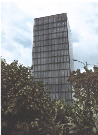
4 Bürohochhaus Obsidian, Zürich, 2004.