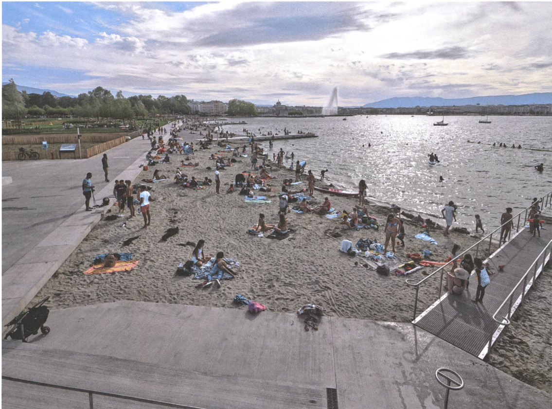
Der 400 Meter lange Kiesstrand ist in mehrere Badebuchten gegliedert.