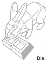
Die Jury sagt

Quai Gustave-Ador, Genf Bauherrschaft: Kanton Genf, Service du lac, de la renaturation des cours d'eau et de la pêche Landschaftsarchitektur und Planung Sanitärgebäude (Badehäuschen): Atelier Descombes Rampini, Genf Architektur Restaurant und Fischereianlage (siehe Seite 24): LLI, Genf Bauingenieure: EDMS, Petit-Lancy Hydrogeologie: Hydro-Géo Environnement, Petit-Lancy Geotechniker: Karakas & Français, Petit-Lancy Landvermesser: Adrien Kúpfer, Genf Umweltingenieure: Viridis, Petit-Lancy Agronomen: Acade, Petit-Lancy Ingenieure für Sicherheit und Materialwirtschaft: Ecoservices, Carouge Heizungs- und Lüftungstechniker: JDR énergies, Confignon Sanitärtechniker: Frédy Margairaz, Genf Elektroingenieure: Zanetti, Petit-Lancy Verkehrsplanung: Citec, Les Acacias Bausumme Hafen und Strand (BKP 1-9): Fr.67 Mio.