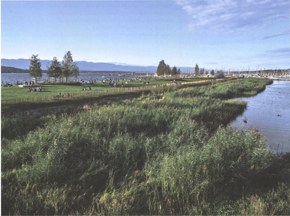
Zwischen Quai und Strand liegt eine ruhige Flachwasserzone: ein neuer Lebensraum für Tiere und Pflanzen mitten in der Stadt.