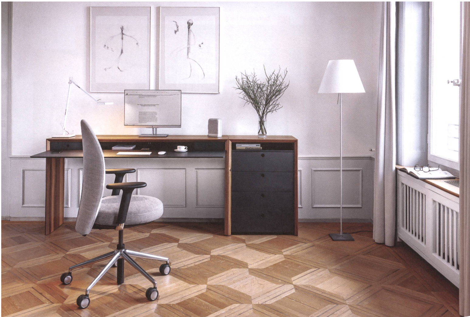
Marva. Wohnlicher Drehstuhl mit allen ergonomischen Funktionen. Design: Mathias Seiler