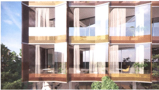
Fassade mit Loggien.