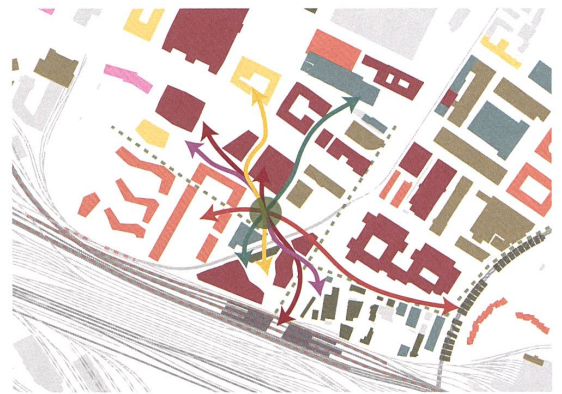
Auftakt für das gesamte Quartier in Zürich West.