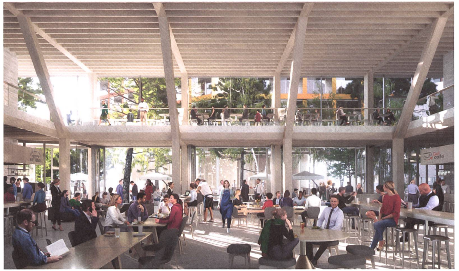
Die Markthalle im Erdgeschoss des Kulturhauses.

«Die Projektstrategie von Sauerbruch Hutton ehrt die industrielle Vergangenheit und macht diese weiterhin im Quartier spürbar. Gleichzeitig schafft sie mit dem charmanten «Stadtwald» einen grosszügigen, zentralen Aussenraum mit identitätsstiftendem Charakter.»