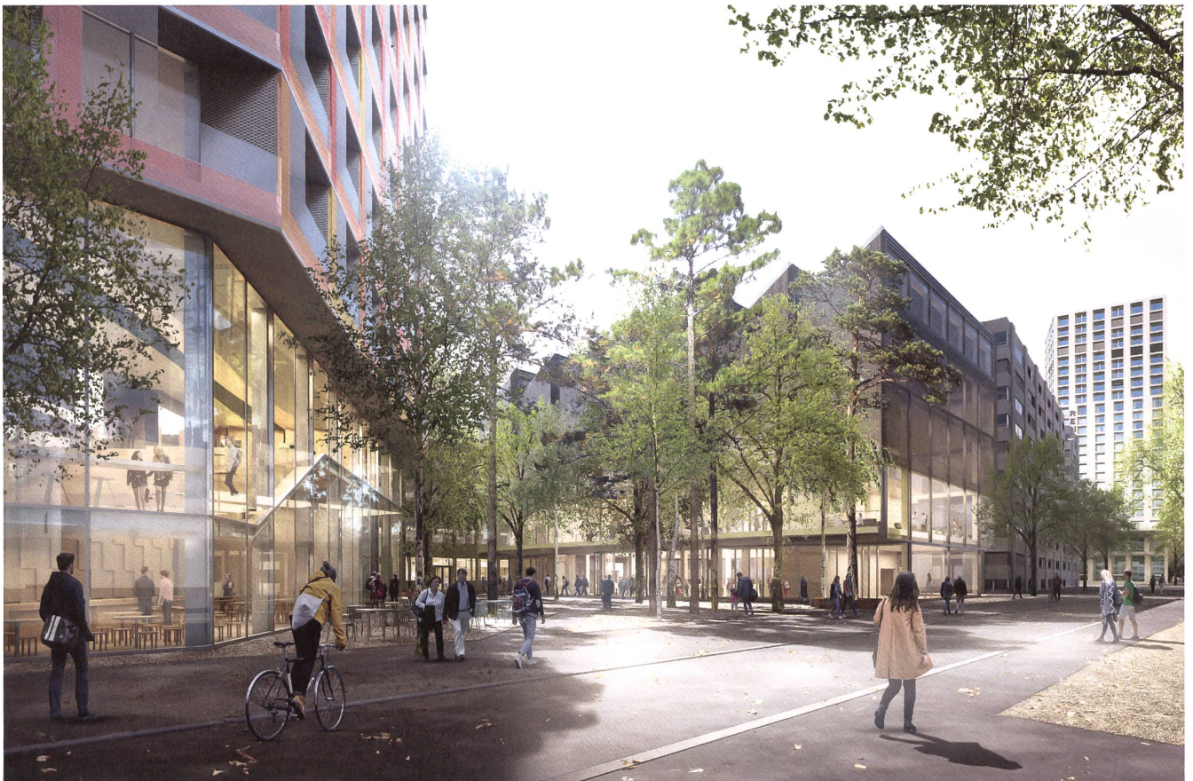
Ein Hain aus hochstämmigen Bäumen zwischen den Neubauten.