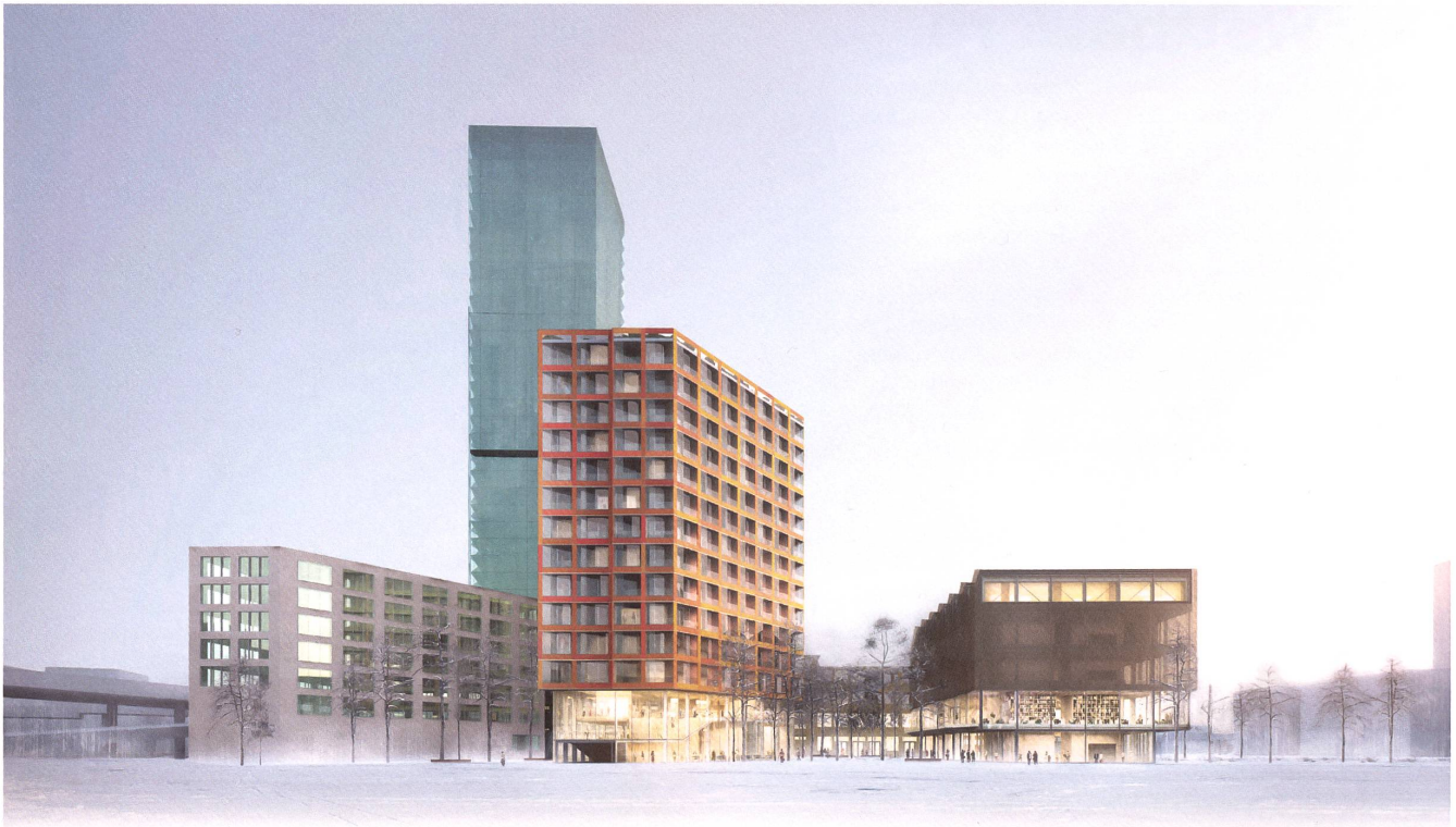
Die neuen Bauten des Siegerprojekts von Sauerbruch Hutton (rechts und Mitte) ergänzen die vorhandenen.