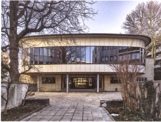
Die First Church of Christ Scientist beim Basler Picassoplatz. | La First Church of Christ Scientist sur la place Picasso à Bâle.