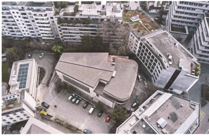
Der Saalbau steht als Solitär in einem Hof nahe des Stadtzentrums. | La grande salle sous forme de bâtiment solitaire dans une cour, près du centre-ville.