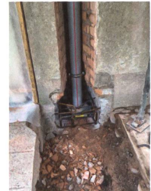
Die Mauerschlitze werden zubetoniert und die Stangen vorgespannt. | Les fentes seront ensuite bétonnées et les barres précontraintes.