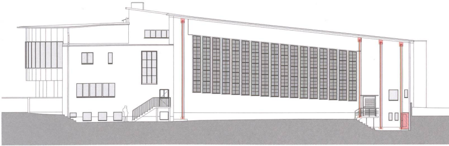
Die Anordnung der Mauerschlitze in der Ostfassade zeigt die Zurückhaltung des Eingriffs. | La disposition des fentes dans la façade Est révèle une intervention discrète.