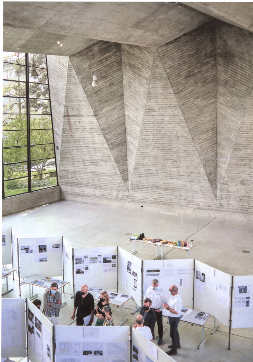
Ort der Jurierung war die sechzigjährige Maurerhalle der Gewerbeschule Basel. | Le jugement s'est déroulé dans la halle des maçons de l'École professionnelle de Bâle, réalisée il y a tout juste soixante ans.