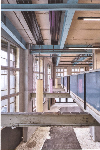
Mitnehmen, was geht: Auch im Bestand ist maximaler Substanzerhalt die Devise, die Bricolage das Ziel.