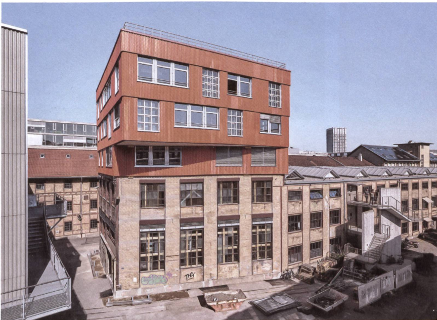
Grauenergie-Champion dank Wiederverwendung: Die Aufstockung in Winterthur nutzt, was sonst auf der Deponie landet.

Lagerplatz 24, Winterthur ZH Bauherrschaft: Stiftung Abendrot, Basel Architektur: Baubüro In Situ, Zürich (Marc Angst, Pascal Hentschel, Benjamin Poignon) Baustatik: Oberli Ingenieure, Winterthur Bauphysik: 3D Bauphysik Huth, Glashütten Holzbau: Zehnder, Winterthur Stahlbau: Wetter, Stetten Anlagekosten (BKP 0–5): Fr. 5,3 Mio.