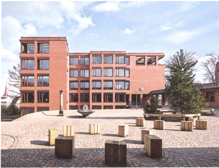
Oberstufenschule Röhrlberg in Cham: Das zusätzliche Geschoss und der neue Gebäudeflügel stärken die räumliche Kraft des Pausenhofs.