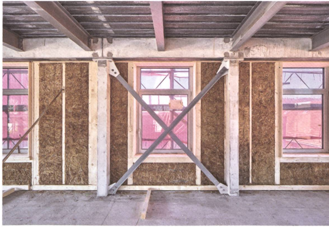
Materiali poveri: Die Fassade besteht aus Holz, Lehm und Stroh.