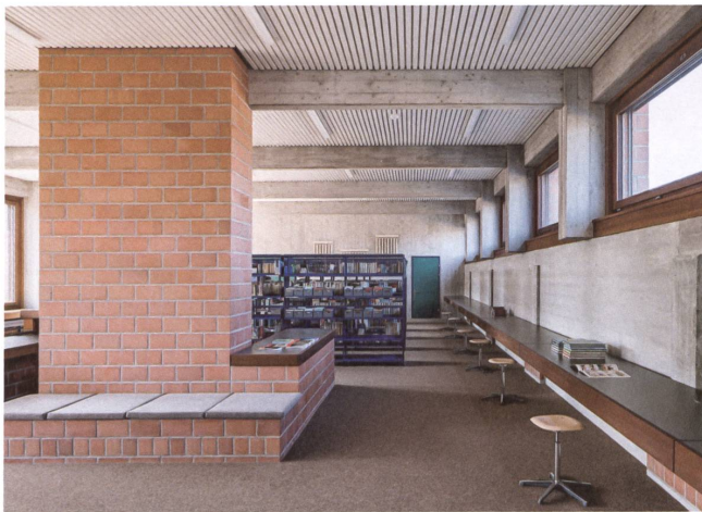
In der neuen Bibliothek wurde ein bestehender Schacht verlängert und zu einer Sitzgruppe ausgebaut.