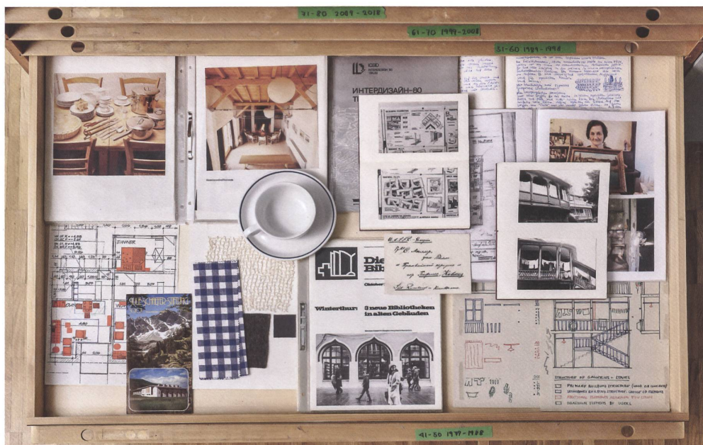
Schublade 1979–1988: Neben der Gestaltung der Winterthurer Bibliotheken tauchen mit Georgien erste sowjetische Akzente auf.