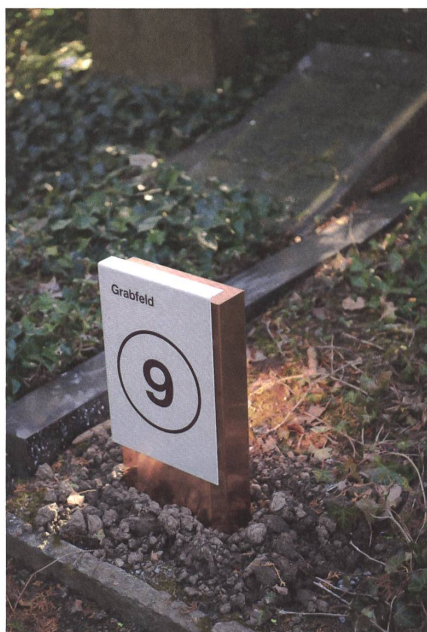
Auch dort, wo die Grabfelder nicht systematisch geordnet sind, soll das neue Signaletiksystem für mehr Orientierung sorgen.