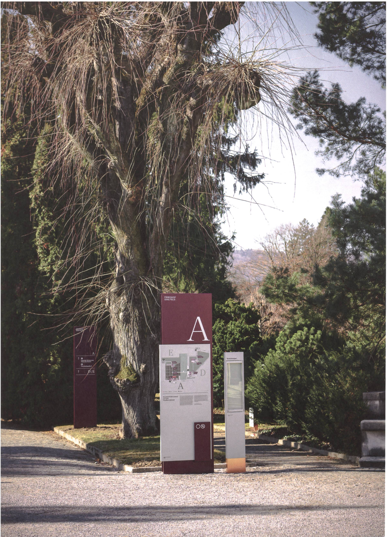
Derzeit läuft der Praxistext auf dem Friedhof Sihfeld. Ab 2023 soll die Signaletik auf allen 19 städtischen Friedhöfen in Zürich zum Einsatz kommen.