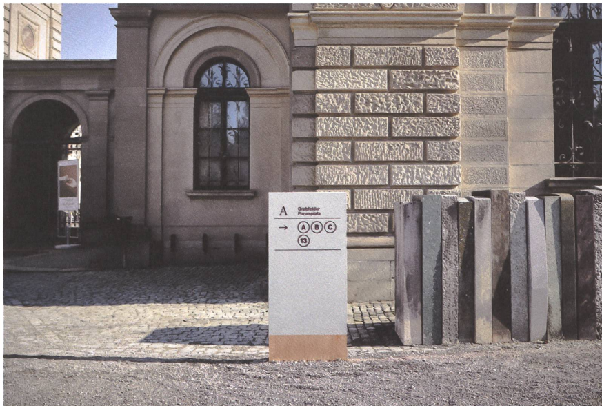
Mit dem Projekt «Erinnerungslandschaften» überzeugte das junge Designstudio M-D-Buero im Wettbewerb.

→ absteigenden Hausnummern orientieren. Das ist auf Friedhöfen nicht möglich. M-D-Buero schlug deshalb vor, Hauptwege ohne Namen zu definieren, die zu Plätzen führen. Von dort werden die Besucherinnen und Besucher weiter zu den Grabfeldern geleitet.