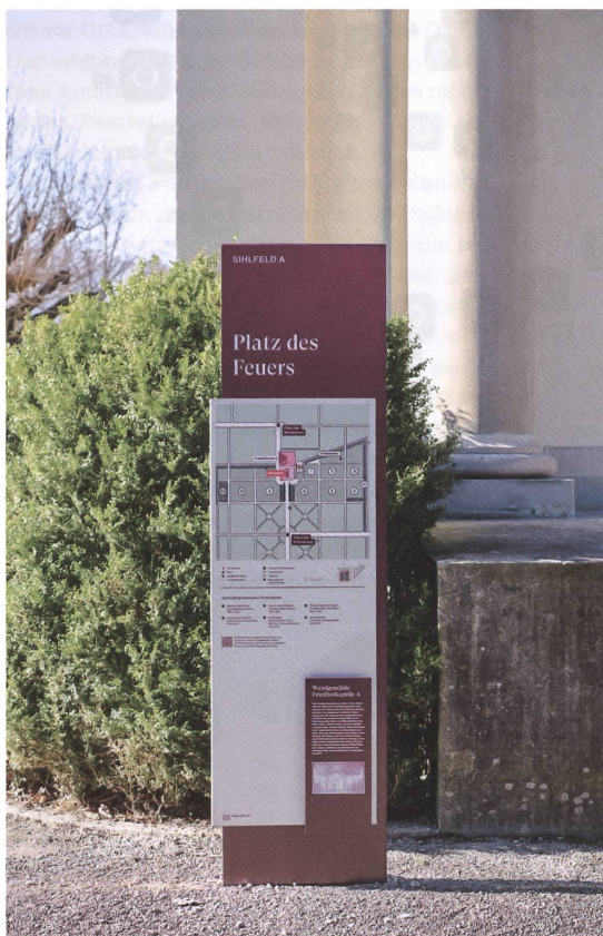
Weil die Wege keine Namen tragen und Grabfelder nicht logisch nummeriert sind, haben die Grafikerinnen neue Plätze definiert, die durch die Anlage leiten.

Historische Pläne von Park- und Friedhofsanlagen dienen als Inspiration für die Gestaltung der Icons und Gebäude, die dank der gewählten Darstellungsart leicht erkennbar sind.