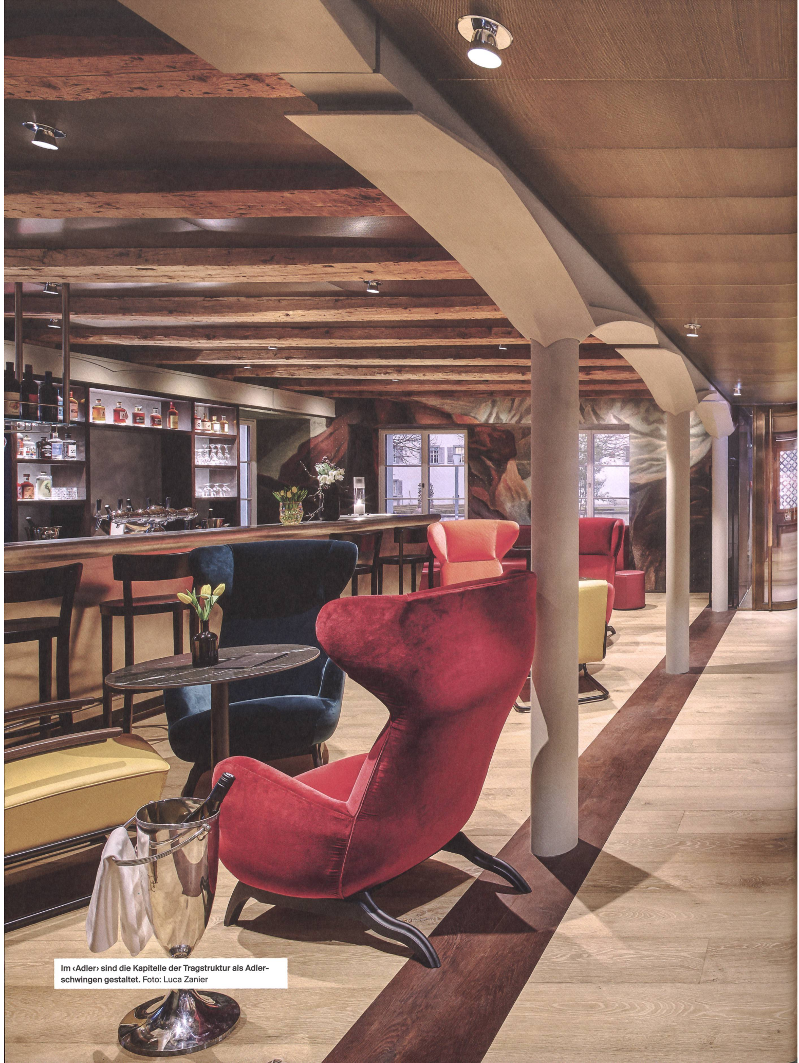
Im «Adler» sind die Kapitelle der Tragstruktur als Adlerschwinge gestaltet.