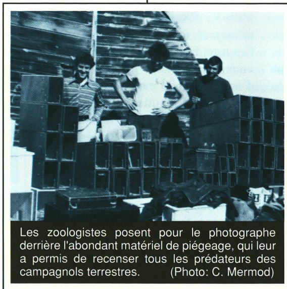
Les zoologistes posent pour le photographe derrière l'abondant matériel de piégeage, qui leur a permis de recenser tous les prédateurs des campagnols terrestres.