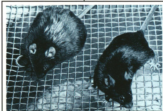
Le diabète touche près d'une personne sur 50. Heureusement pour la recherche médicale, il existe plusieurs souches de souris affligées de la maladie. A gauche, une souris obèse, qui présente un diabète de type 2 proche de celui des humains. A droite, une souris normale. (Diabetologia)

Après une seule injection, les souris diabétiques montrèrent une baisse spectaculaire de la concentration du sucre dans le sang, se prolongeant pendant plusieurs heures. Leur glycémie, trop élevée du fait de leur diabète, descendait ainsi à des valeurs normales.