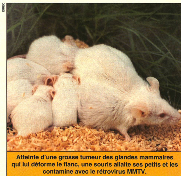
Atteinte d'une grosse tumeur des glandes mammaires qui lui déforme le flanc, une souris allaite ses petits et les contamine avec le rétrovirus MMTV.

Ces observations sur la souris, impossibles à faire sur l'homme ou sur les singes, sont particulièrement intéressantes. En effet, la transmission sexuelle du virus du sida