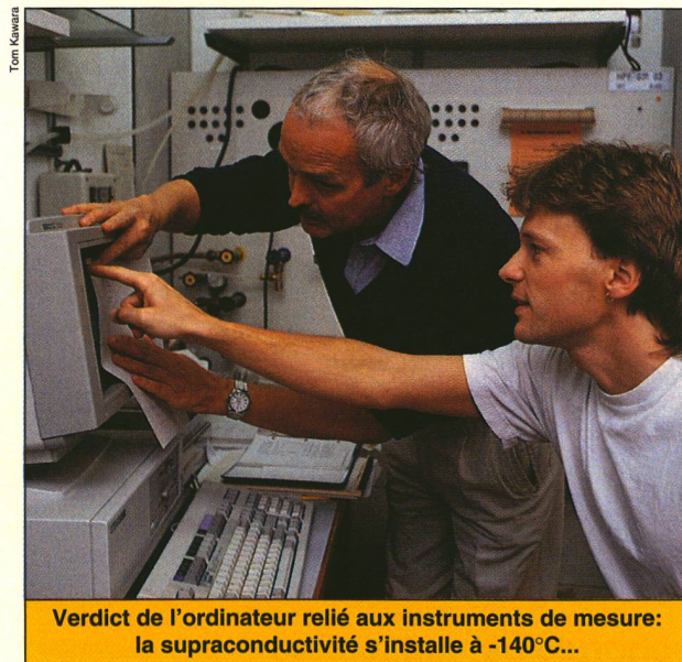
Verdict de l'ordinateur relié aux instruments de mesure: la supraconductivité s'installe à -140^{\circ}\text{C} ...

on était très loin du but. Il fit l'expérience avec du mercure plongé dans de l'hélium liquide, à -269^{\circ}\text{C} ! Pour engendrer ce froid extrême, il dut évidemment dépenser énormément d'énergie – bien plus qu'il aurait pu en épargner grâce à l'absence de résistance du mercure. Depuis lors, l'idée d'obtenir une supraconductivité économique ne lâcha pas le monde scientifique. On chercha donc longuement des matériaux dotés d'une meilleure «température critique» – nom donné au point où un conducteur d'électricité devient soudainement supraconducteur.