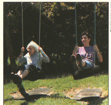
Ospedale civico, Lugano

La sécurité sociale en Suisse : un univers peu exploré jusqu'ici. Ce qui donne un très grand intérêt aux travaux du Programme national de recherche 29 qui s'achèvent cette année pour la plupart.