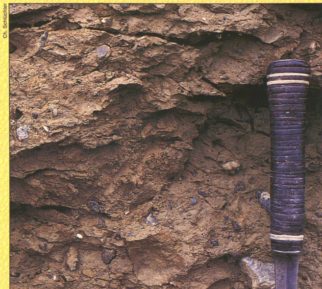
Le Glacier de l'Aar est passé par là. Sous le fleuve de glace, une moraine de fond a été déposée. Elle est constituée d'une masse sableuse-argileuse brunâtre dans laquelle «flottent» des débris rocheux arrondis ou anguleux de toutes tailles et de toutes natures (calcaire, grès, gneiss, granite...) Ce type de dépôts se retrouve tout au long de la vallée de l'Aar, entre Thoune et Berne.