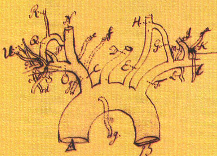
Johann Friedrich Meckel: annexe à la lettre à Haller du 13 janvier 1750

Il n'est guère étonnant qu'un homme qui s'intéressait à tant de sujets différents ait correspondu dans autant de langues: 20% des lettres reçues par Haller sont en latin, 40% en français, 25% en allemand et 15% en anglais. Au plus fort de ses échanges épistolaires, Haller a reçu 600 lettres en une seule année! C'était en 1752. Sinon, la moyenne annuelle tourne autour des 300 lettres – soit une par jour, si l'on excepte les dimanches. Or, chaque lettre a dû être lue, comprise, et honorée d'une réponse réfléchie. De surcroît, beaucoup de lettres possèdent en annexe des plantes séchées, ou des livres, ou encore