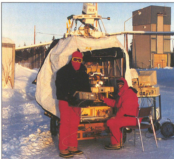
Observatoire de Genève