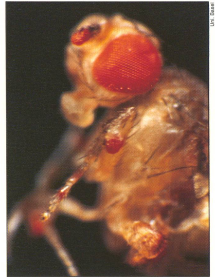
Une drosophile avec des yeux rouges supplémentaires au bout des antennes et sur les pattes.