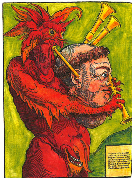
Caricature allemande sur la débauche des moines (Gravure sur bois, 1525)

L'étude est sur le point d'être éditée et les données informatisées seront bientôt disponibles à d'autres chercheurs. Sorti de l'oubli, l'ouvrage de Frère Rutger a dévoilé une intéressante page d'Histoire. Or, chaque cité européenne compte au moins deux bibliothèques où dorment des centaines de tels manuscrits. Les historiens ont encore de beaux jours devant eux. ☞