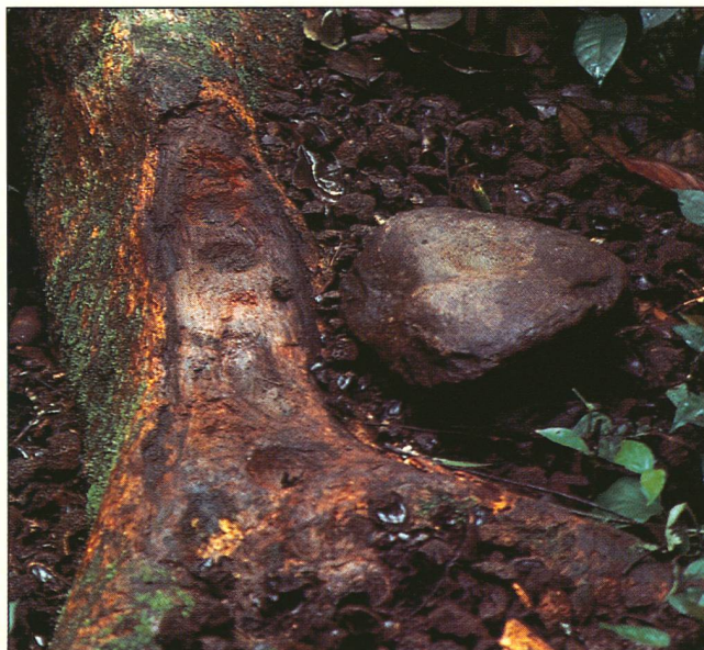
Un «atelier chimpanzé» pour le cassage des noix ( Panda oleosa ): une racine sert d'enclume et un morceau de granite fait office de marteau.

«Voilà deux populations voisines, qui partagent pourtant un même environnement, mais qui ont des habitudes différentes. Cet état plaide en faveur de l'existence de la culture chez les chimpanzés», argumente