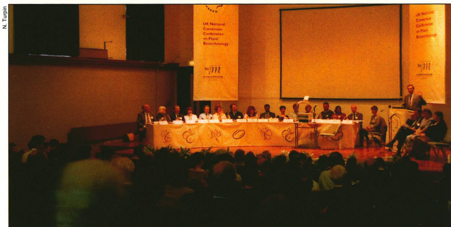
Conférence de consensus «anglaise» organisée au Musée des sciences (nov. 1994)

ment; les progrès de la génétique qui bouleversent l'éthique... En conséquence, elle met en doute la légitimité des choix politiques en la matière. Le politicien n'est pas à l'aise non plus, car il doit décider de sujets qu'il maîtrise mal. Quant aux experts – scientifiques ou ingénieurs – ils se plaignent que le public et les politiciens comprennent mal leur langage, et que l'émotivité prenne souvent le dessus sur la