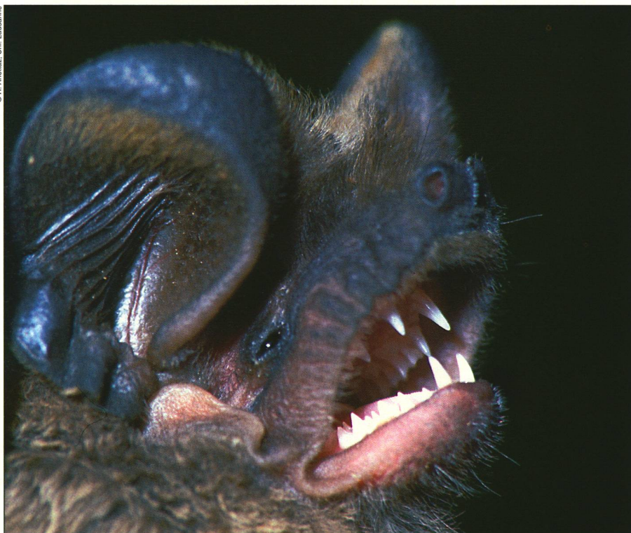
Le Molosse de Cestoni est un cas unique chez les mammifères: en cours d'hibernation, il se réveille régulièrement pour aller chasser les papillons de nuit.

Le Molosse pris en chasse cette nuit-là porte à son cou un collier équipé d'un micro-émetteur qui pèse à peine deux grammes, et dont la portée est limitée à deux kilomètres environ. Dans la voiture, le zoologue écoute avec la plus grande attention le signal retransmis par un récepteur calé sur la fréquence du micro-émetteur. Pour localiser la chauve-souris, il n'a qu'une indication: l'intensité du signal reçu. Signal puissant: le Molosse est tout