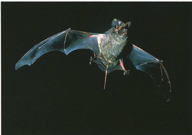
Le Molosse de Cestoni se reconnaît à sa queue bien détachée.

proche; signal faible: l'animal s'éloigne dans la nuit. Pour maintenir le contact avec la chauve-souris, il lui faut réagir vite en modifiant la vitesse du véhicule ou en changeant de direction. «Les poursuites nocturnes m'ont emmené dans la vallée du Rhône jusqu'à Martigny, et même jusqu'au val d'Illiez», raconte le scientifique. «Le contact a été perdu maintes fois. Mais le plus souvent, il m'a été possible de le rétablir, en quadrillant autour de la zone où l'animal avait échappé à mon contrôle.»