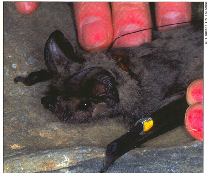
Ce Molosse est équipé d'un collier qui permet d'enregistrer sa température corporelle et de suivre ses déplacements.

Ainsi, lorsque le gîte d'un Molosse reste à une température basse durant plusieurs jours, les pertes en ressources énergétiques s'élèvent rapidement. Pour équilibrer son budget énergétique, l'animal doit alors compenser ces pertes par des apports alimentaires périodiques.