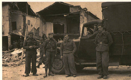
Un blindé des troupes républicaines (photo du haut); des combattants suisses en Espagne devant une maison détruite par les fascistes, à Torjia, en mars 1937 (photo du bas).