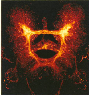
Le cerveau de la mouche drosophile est grand comme un centième de tête d'épingle.

La recherche neurologique s'intéresse de très près aux mécanismes moléculaires et génétiques qui commanderaient le développement du cerveau humain. Un groupe de