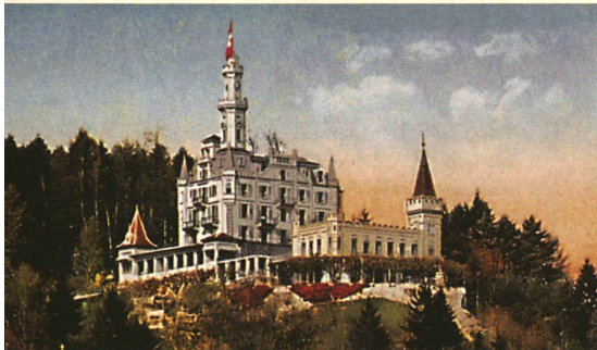
Plusieurs styles marquent l'évolution des hôtels suisses du 19 e siècle (de haut en bas):

Campagnard avant 1830: Interlaken, pensions Victoria, Jungfrau et Schweizerhof.