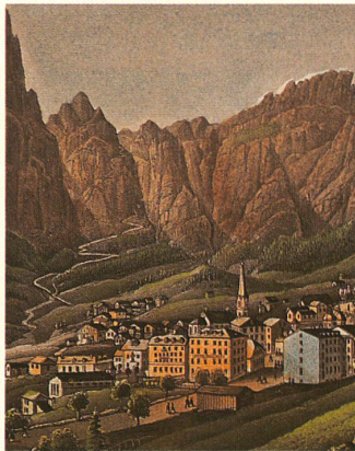
Loèche-les-Bains, vers 1865.

Dans la station thermale valaisanne de Loèche-les-Bains, les installations hôtelières se sont développées exceptionnellement tôt. Bien que situé à l'écart des grands axes de trafic, le village a connu un boom de la construction hôtelière dès 1830: vers le milieu du siècle, on recensait 7 hôtels et pensions d'envergure, dont trois bâtis en pierre dans le