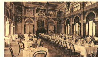
Salle à manger de l'hôtel Monney, Montreux.

Caractéristique de l'hôtel du 19 e : la salle à manger. Alors que dans les premiers établissements, aménagée simplement, elle était située au rez-de-chaussée, elle s'est développée pour devenir une immense salle d'apparat, déplacée bientôt par les architectes dans une annexe spéciale. Étonnamment, les salles à manger des grands hôtels ne donnaient pas du côté où il y a de la vue. On peut l'expliquer par le fait que, dans ce genre d'hôtel, le repas