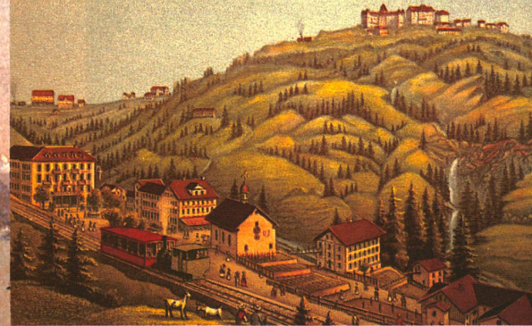
La plus grande concentration d'hôtels sur une montagne suisse: Rigi-Klösterli et Rigi-Kulm.

L e contraste ne pouvait être plus saisissant entre une population montagnarde confinée dans la pauvreté et la misère et vivant dans des maisons au confort rudimentaire et une société de curistes extrêmement fortunés séjournant dans des palaces luxueux. Le Bernois Rudolf von Tavel, à la fin du siècle passé, le soulignait : «En maint endroit, les touristes qui s'aventurent dans les montagnes sont incommodés par les mendiants, jeunes ou vieux».