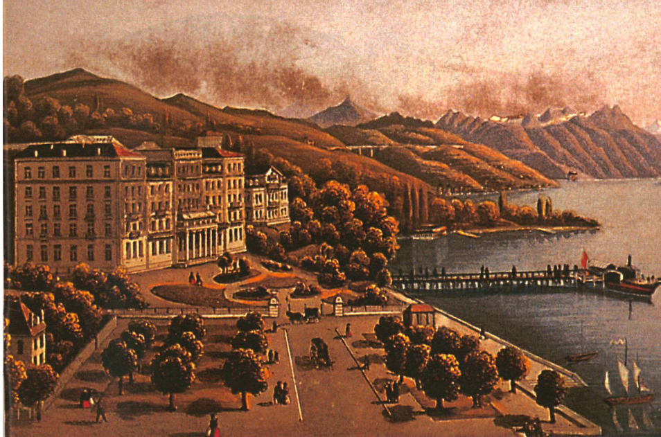
Hôtel d'origine avec façade en cinq corps: Hôtel Beau-Rivage à Ouchy-Lausanne en 1861.