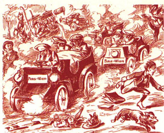
Caricature de 1902, «Nebelspalter»

Les moteurs des toutes premières voitures développaient à peine plus de puissance que des attelages de deux ou quatre chevaux et les véhicules du nouveau type se déplaçaient à des pointes de 20km/h. Soit plus lentement que des chevaux au galop. Avec des moteurs plus puissants et plus fiables et des pneus munis de chambres à air, comme les bicyclettes, les autos n'ont pas tardé à dépasser les quadrupèdes. En 1905 déjà, un bon véhicule de tourisme