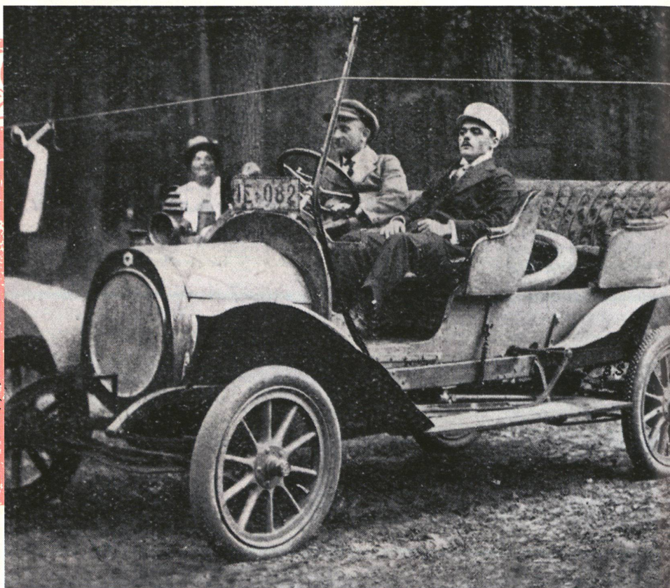
Fondation de l'Automobile M. Berliet (Lyon)

dépassait les 60 km/h sur de bonnes routes. Les voitures de course, elles, établissaient déjà le record de vitesse de 100 km/h en 1899, la barre des 200 étant atteinte en 1909. La vitesse maximale autorisée n'a pas manqué de devenir un thème très discuté: elle était de 30 km/h en 1904 dans la plupart des cantons (ce qui «permet au conducteur de rester maître de sa machine»). En 1911, elle passait à 12 km/h dans les localités et à 40 km/h en dehors. La mesure de référence était alors le trot d'un cheval. L'exigence d'installer des compteurs et d'organiser des contrôles a toujours été liée aux débats sur les limitations de vitesse. Celles-ci ont été provisoirement abolies en Suisse en 1932, mais les voitures devaient alors en contrepartie être équipées d'un «dénonciateur de vitesse».