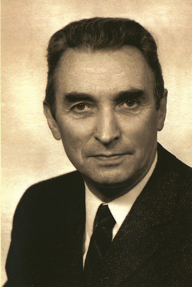
Charles Haenny est considéré comme pionnier dans l'étude des rayonnements cosmiques.

non négligeable associée à une vitesse importante les rend très énergétiques. Ils peuvent atteindre 1020 électrons volts, l'équivalent d'une balle de tennis bien servie, tout en étant contenus dans un corps d'une taille incroyablement petite.