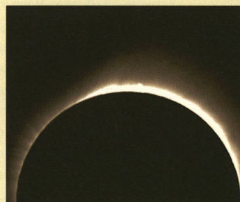
1954: la structure rayonnante de la couronne du soleil du pôle Nord.