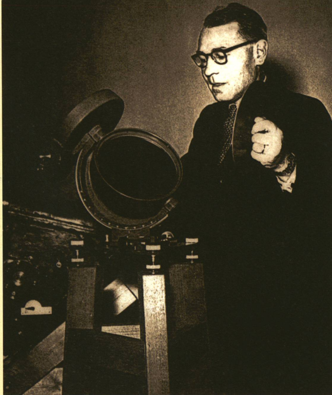
Max Waldmeier (photo prise en 1952) contrôle les instruments qu'il prendra pour ses expéditions.

de soleil totale. C'est ainsi que l'astronome décide de compléter sa recherche par des observations intensives dans des conditions idéales.