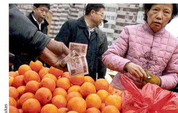
Vue de Shanghai avec le fleuve Huangpu et la célèbre promenade du Bund (à gauche). Marché à Pékin (ci-dessus). Les caractères chinois dans le texte signifient «Chine» (en petit, page 18) et «droits de l'homme» (en grand, page 19).

qui a intériorisé des valeurs bouddhistes classiques, la méditation, le fait de supporter l'injustice ou d'accepter les aléas de la vie, demeure plutôt indifférente à ces droits.