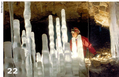
L'étude des glaciers du Jura donne de précieuses indications sur l'évolution du climat.