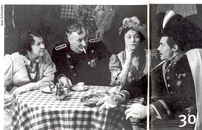
Le premier grand dictionnaire sur le théâtre en Suisse.