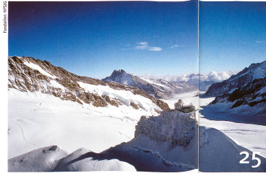
Jungfrauoch: la plus haute station de recherche d'Europe à 75 ans.