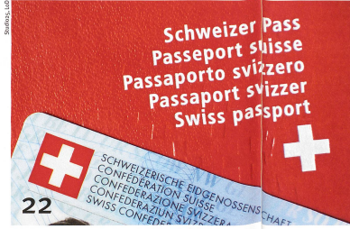
L'obtention du passeport suisse est une course d'obstacles.