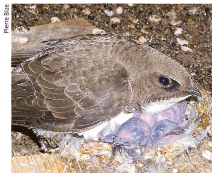
Les martinets alpins ( Apus melba ) nichent sous les toits des hauts édifices.

Animal Behaviour , (2006), 72, pp. 539-544