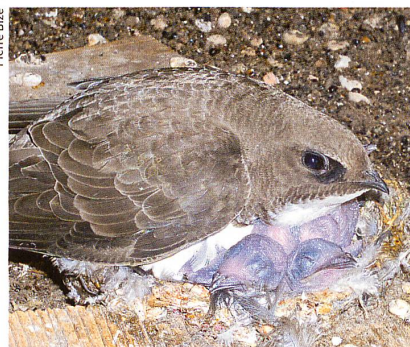
Les martinets alpins ( Apus melba ) nichent sous les toits des hauts édifices.

Animal Behaviour , (2006), 72, pp. 539-544