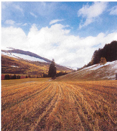
Selon un nouveau modèle de calcul, une libéralisation totale de l'agriculture pourrait déboucher sur une réduction d'un cinquième des surfaces agricoles.