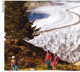
Les traces d'anciens glaciers ont permis, il y a 200 ans, aux géologues de faire des découvertes sur la formation de la Terre.