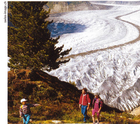
Les traces d'anciens glaciers ont permis, il y a 200 ans, aux géologues de faire des découvertes sur la formation de la Terre.