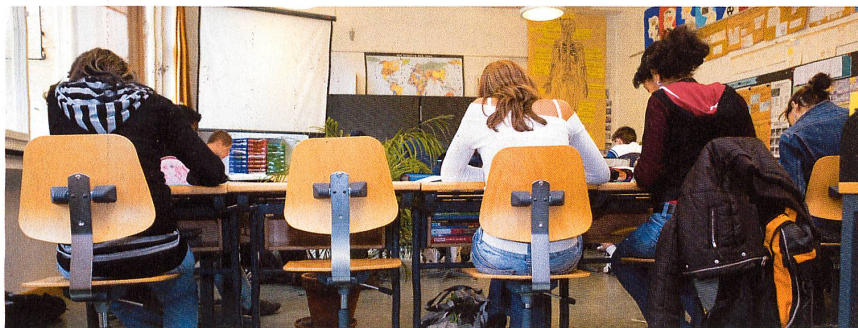
La plupart des élèves sèchent les cours parce que l'école les ennue.