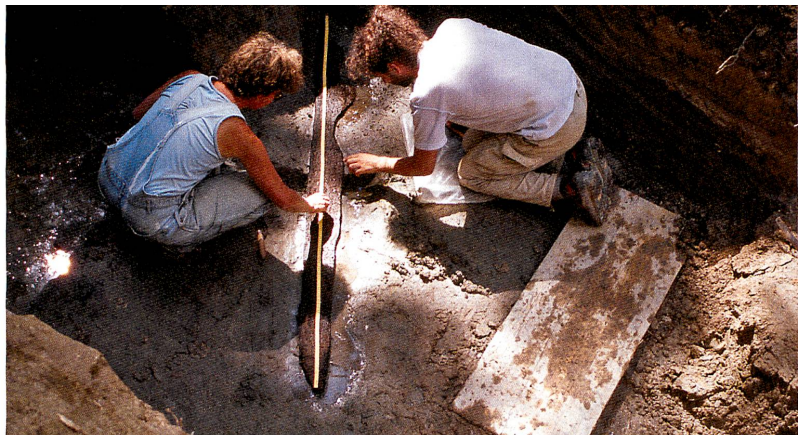
Laténium (2), Musée Schwab (3)