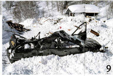
Une avalanche meurtrière en France. Aurait-on pu l'éviter?