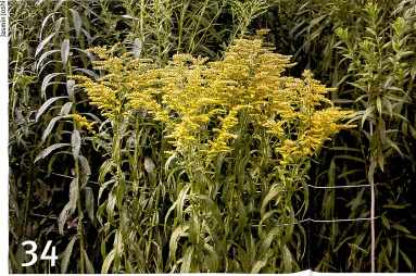
Les plantes invasives utilisent des moyens perfides pour s'imposer.