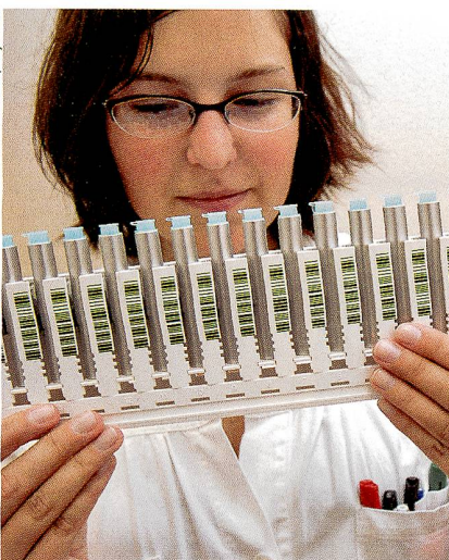
Des substances exogènes ?

Law, Probability and Risk , 2008, vol.7, n°3, pp. 191-210