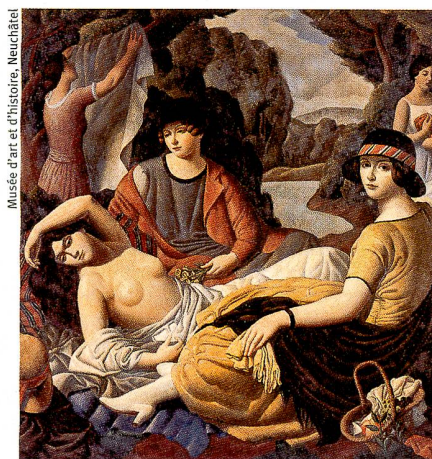
«Après le bain», 1921-22