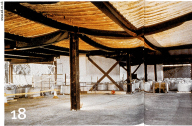
La chaleur ramollit les charpentes en acier. Des chercheurs tentent de les rendre plus résistantes en cas d'incendie.