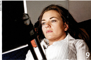
L'exposition à la lumière permet de soulager les personnes dépressives.